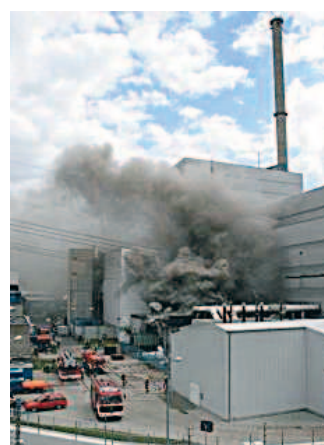
Brand im Kernkraftwerk Krümmel, Sommer 2007

Die Atomtechnik ist unbeherrschbar , wie die Störfälle und Reaktorkatastrophen belegen. Den deutschen Atommeilern wird von Amts wegen sogar höchste Gefährlichkeit bescheinigt (Deutsche Risikostudie Kernkraftwerke, Innenminister Zimmermann 1979 und Bundesumweltminister Klaus Töpfer 1989). Die Auswirkungen sind nach dieser Untersuchung noch schlimmer als nach Tschernobyl: 14.000 Sofort-tote und hunderttausende sog. Langzeittote . Die Wahrscheinlichkeit dafür ist nicht gering, sondern liegt für jeden Reaktor höher als ein Promille, für 200 Reaktoren in Europa also über 20% . Das ist mehr als die Wahrscheinlichkeit, auf Anhieb eine Sechs zu würfeln (16,7%).