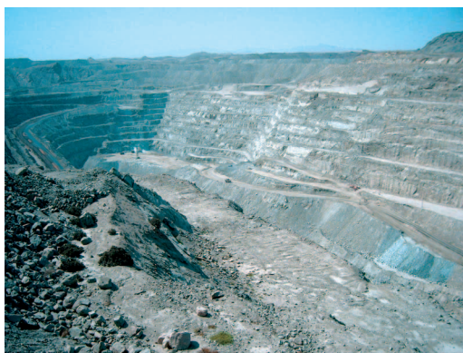
Uranabbau in Namibia

In Wirklichkeit muss das Uran, der Brennstoff für Atomkraftwerke, zu 100% nach Deutschland eingeführt werden (Quelle: BMWi). Außerdem wird durch den Abbau, den Transport und die Anreicherung des Urans auch Kohlendioxid (CO 2 ) freigesetzt (laut Ökoinstitut 32 kg CO 2 /MWh).