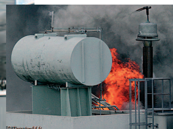
Brand im Kernkraftwerk Krümmel, Sommer 2007