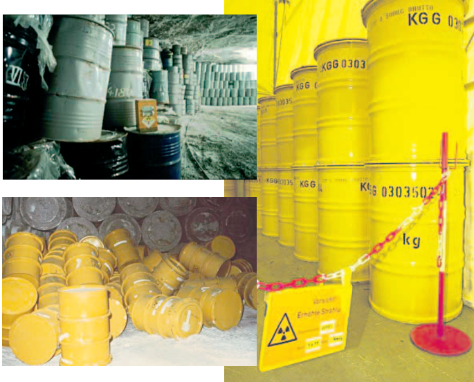
Atommüll im Salzstock Asse II und Lager Morsleben

In Wirklichkeit ist bisher kein Gramm hochradioaktiven Atommülls sicher und dauerhaft entsorgt worden. Im Gegenteil: Asse II säuft gerade ab. Eine Endlagerstätte müsste den sicheren Einschluss des Mülls für mindestens eine Million Jahre sicherstellen.